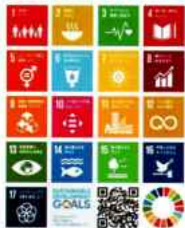
世界を変えるための17の目標

業所を作り、同時にそこで働くということ。さいたま高齢協は、岩槻と所沢の2か所に事業所があり、訪問介護、福祉移送、ケアプランなどに取組んでいます。全国的には配食事業や生活支援サービス、子育て事業に取り組み高齢協が存在します。また、老人ホームや協同墓、終活の相談など高齢者ならではのニーズに応える高齢協もあります。高齢者が元気で活躍できる場を作ることが本来の目的です。 組織や団体において存在目的(理念や使命)は極めて重要です。さいたま高齢協は、自らの存在目的に照らして、現在の活動を見つめ直す必要があると考えています。